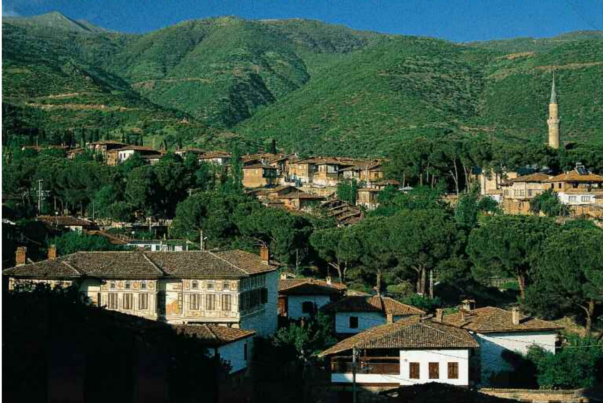
En parlak yıllarını 14. yüzyılda Aydınoğulları Beyliği'ne başkentlik yaptığı dönemde yaşayan Birgi'de tarihin tanıklığını Çakırağa Konağı ve diğer eski eserler yapıyor (solda). Selçuk'taki sa Bey Camii, Aydınoğulları'na ait. Kenarları 50 metre uzunluğunda kare planlı camide 12 taş sütunla çevrili bir avlu bulunuyor. Caminin planı fiam'daki Emeviye Camii'nden başlayıp Diyarbakır, Ulu Cami'de devam eden bir zincirin halkası (altta).

K adınlar üstlerinde ceylan postundan giysiler, başlarında sarmaşıktan taçlarla çıktığı dağlara. Kalabalıklıydılar. Sert, şiddet yüklü, homurdanan ve heyecanlı kadınlardı. Kutsal bildikleri karanlıkta meşalelerle yol açıyorlardı kendilerine. Horon kolları kurdular önce. Asma yaprağıyla bağlanmış rezene dallarından asalar vardı ellerinde. Zillerin ve büyük davulların sesi önce kadınları sarıyor, sonra yükselerek yeri göğü kaplıyor, kadınlar topluca yapılan dansın ritmiyle kendilerinden geçiyordu. Davul seslerinin eşliğinde parçaladıkları boğaları çiğ çiğ yiyor, böylece hayvan kılığında dolaştığına inandıkları Tanrıları "içlerine" alıyorlardı. Bu kadın alayına Bakkhalar deniyordu.