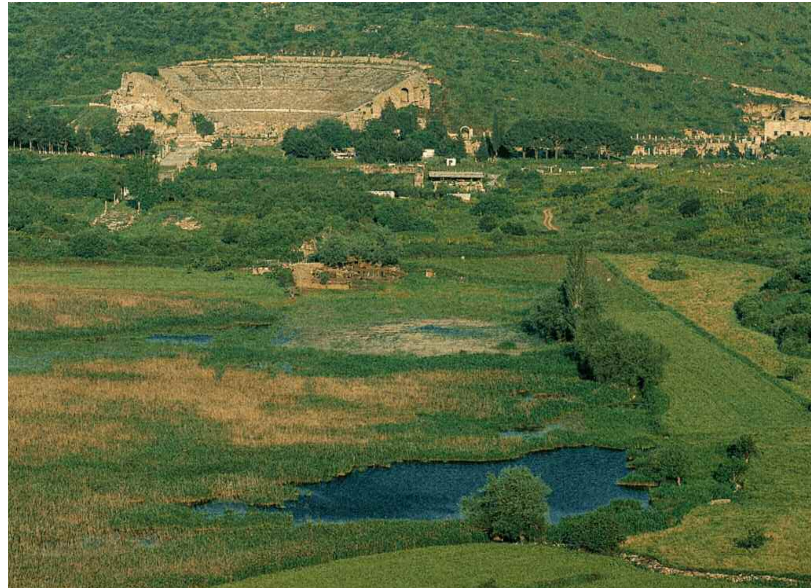
Antikçağın önemli liman kentlerinden Ephesos, Küçük Menderes Nehri'nin taşıdığı alüvyonların denizi doldurmasıyla kıydan uzaklaştı. Günümüzde liman sazlık bir bataklık görünümünde (solda). Küçük Menderes Nehri'nin deltasında rastlanıyor mangutalara. Dionysos şenliklerinde bu bitkilerin meşale olarak kullanıldığına inanılıyor (altta).