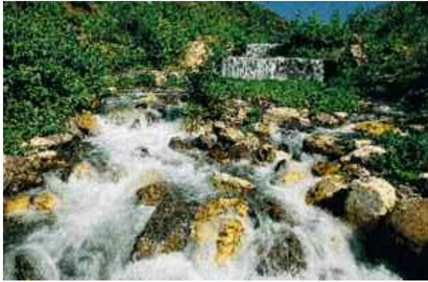
Bayındır sırtlarından Küçük Menderes Ovası'na bakıldığında önde Bayındır kenti, arkada Tire ve Aydın Dağları görülüyor. Yaşlı bir Tirelinin güçlü hafızası şöyle tanımlıyor ovayı: "Mollaarap semtine geldiğiniz zaman zannederdiniz ki cennete geldim. Ay ışığında kurbağa sesleri, gün doğarken bülbüller" (en üstte). Küçük Menderes'te yaz aylarında suyu görmek için ya kaynağına ya da deltasına gitmek gerek. Karakoyun Yaylası'nda doğan ırmak Kıraz Ovası'na inip buradaki derelerle birleşiyor ve Küçük Menderes adıyla akmaya başlıyor (üstte).

Yol boyunca her virajın ardından, teraslanıp incir ağaçları dikilmiş yamaçlar çıkıyor. Eskiden bu kadar çok değilmiş incirlikler, şimdi tazesini de kurusu da para ediyor. "Kurak yazlara bir o dayanıyor" diyerek yönelmiş köylüler incirciliğe. Ellerindeki uzun sııklarla incir toplayan bir karıkocanın ısrarına dayanamayıp iniyoruz bahçelerden birine. "Yemiş dalından yenmelidir" diyerek sepetler dolusu mahsulün yanından geçirip yaşlı bir ağacın dibine götürüyorlar bizi. Hepsi lezzetli ama yaşlı ağaçların meyvesi bir başka. "Dokanmaz hiç korkma. Ye, ye" ısrarının sonu yok. Bahçede genç fidanlar çoğunlukta. Onlara "deli" diyorlar. Deli asma, deli incir, deli ceviz, deli kestane... Henüz aşılmadıklarından meyve vermezlermiş, verseler de tatsız olurmuş. İnsan delisini getiriyor akla. Acıdan, yoktan, yoksunluktan geçmemiş, henüz olgunlaşmamış ademoğluna bu yüzden mi "delikanlı" derler?