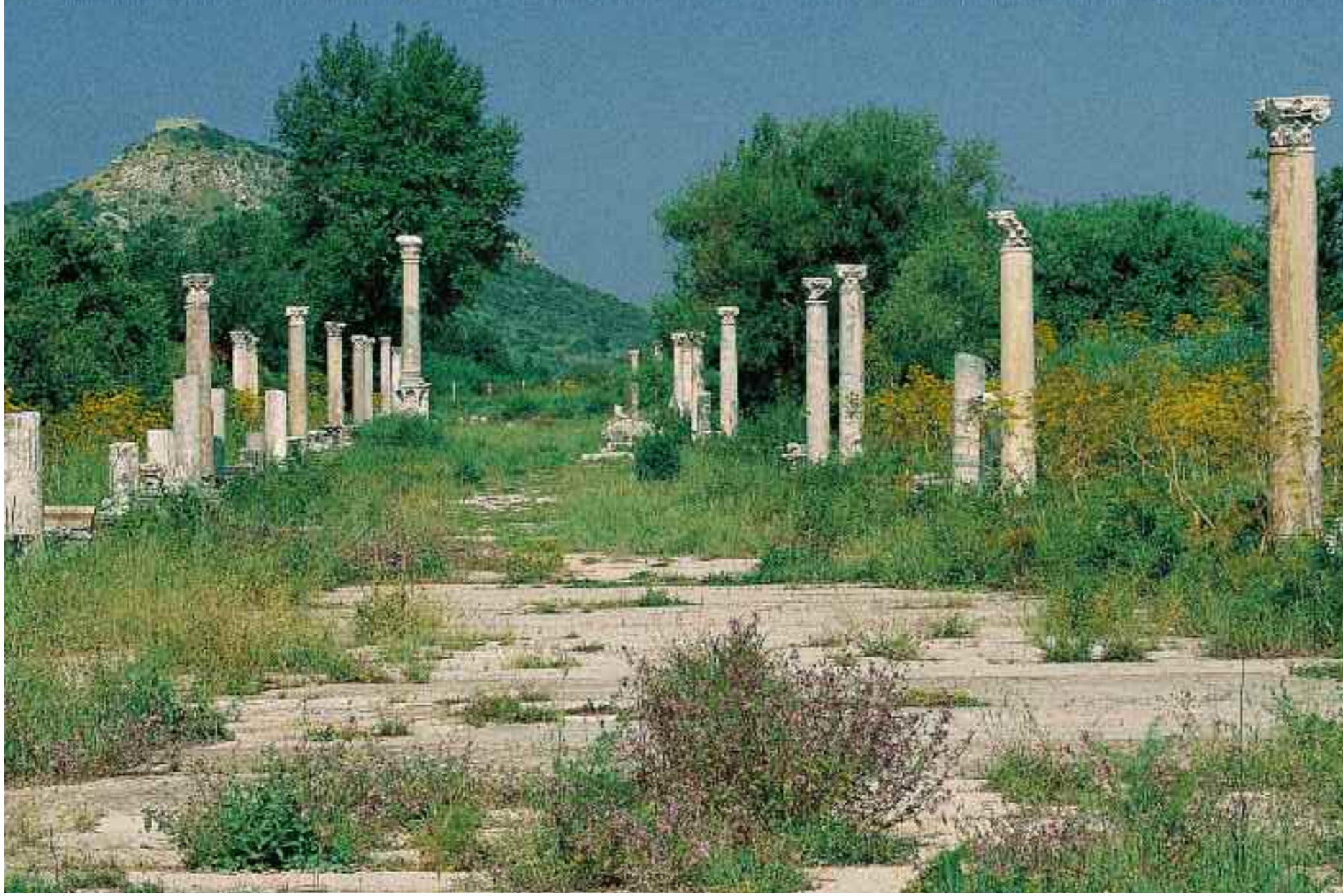
Liman Caddesi, antik Ephesos kentinin limanı ve tiyatrosu arasında uzanıyor. Küçük Menderes Havzası'nın ürünlerindeki bolluk, liman kenti Ephesos'un zenginleşmesinde büyük rol oynadı (solda). Küçük Menderes Havzası'ndaki ekili alanlardan yılda üç kez ürün alınabiliyor. Binlerce yıldır bereketini esirgemiyor toprak. Ama her yıl biraz daha tuzlanıyor ve vasıflarını kaybediyor. Kavak köyünün sakinleri de eski ürün kalitesini bulamamaktan şikâyetçi (altta). Metropolis, antikçağda havzada yaşayan Seleukoslar tarafından kurulduğu tahmin edilen ve Geç Hellenistik devirde büyük gelişme gösteren bir kent. Restorasyon çalışmalarının devam ettiği kentte tiyatronun onarımı tamamlandı (en altta).